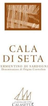
CALA DI SETA 2016 Vermentino di Sardegna D.O.C.