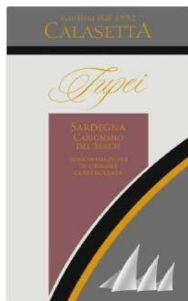
TUPEI 2015 Carignano del Sulcis D.O.C.