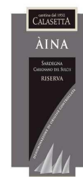
AINA 2013 Carignano del Sulcis D.O.C. Riserva