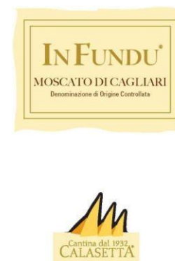
IN FUNDU 2015 Moscato di Cagliari D.O.C.