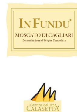
IN FUNDU 2015 Moscato di Cagliari D.O.C.