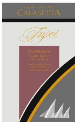
TUPEI 2015 Carignano del Sulcis D.O.C.