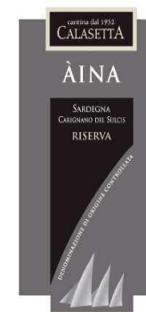
AINA 2013 Carignano del Sulcis D.O.C. Riserva