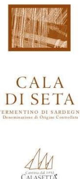
CALA DI SETA 2016 Vermentino di Sardegna D.O.C.